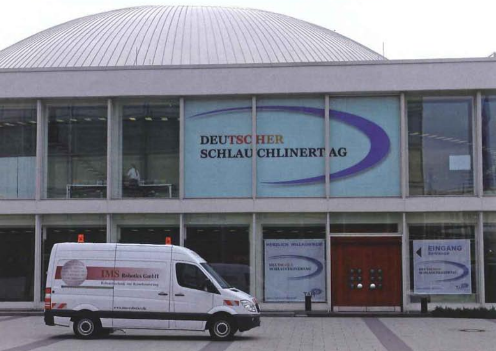
„Renovierung hat die Erneuerung überholt“ lautete die Botschaft auf dem 10. Deutschen Schlauchlinertag, der am 20. März im Berliner Kongresszentrum stattfand.