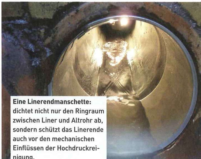
Eine Linerendmanschette: dichtet nicht nur den Ringraum zwischen Liner und Altrohr ab, sondern schützt das Linerende auch vor den mechanischen Einflüssen der Hochdruckreinigung.

Die Besucher des 1. Deutschen Reparaturtages erwartet ein aktuelles und vielseitiges Programm, das sich eingehend mit den verschiedenen Facetten der Reparaturverfahren beschäftigt. Auf